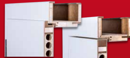
Zarge und Türblatt gefäلت