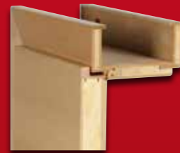
Zarge und Türblatt überfäلت