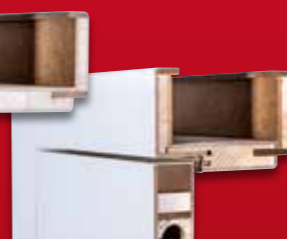
Zarge und Türblatt stumpf