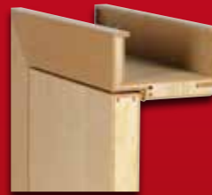
Zarge und Türblatt stumpf